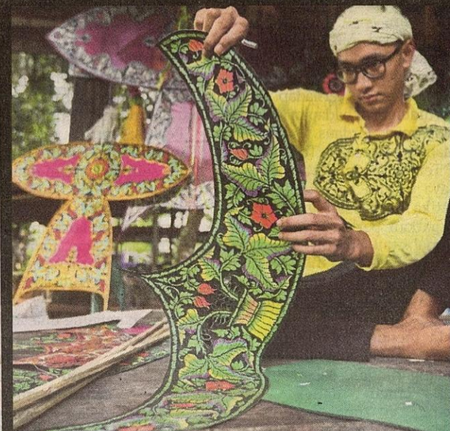
KERJA menampal memerlukan ketelitian dan berhati-hati supaya ukiran pada kertas tidak rosak atau koyak.