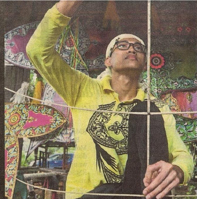
WAU dihasilkan menggunakan bahan asas iaitu buluh berang atau buluh duri.